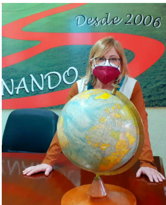
La directora, docente de Geografía, en su despacho.

-Sentí mucha responsabilidad, porque conocía las tareas que iba a realizar. El trabajo era un gran reto, pero gracias a mi gran equipo directivo todo fue mucho más fácil. El trabajo es muy duro, y una tiene que hacer frente a muchos problemas. Además, la pandemia ha acrecentado más las dificultades. Y es que tuvimos