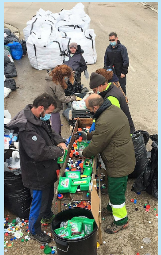
Varios voluntarios, en el proceso de recogida.