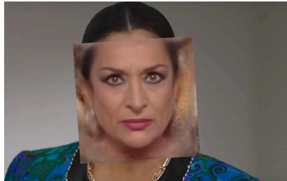
Imagen del juego de Eraser y el deepfake de Lola Flores.